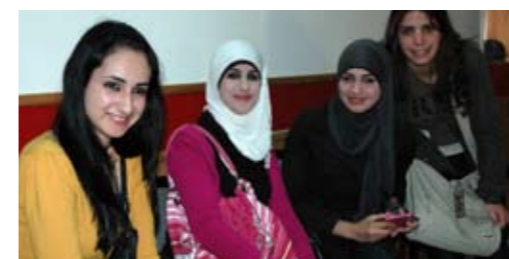
60 JOURNALISTAR DELTOK PÅ KONFERANSEN I RAMALLAH I NOVEMBER 2009. KONFERANSEN VAR EIN DEL AV ETHICAL JOURNALISM-PROSJEKTET SOM UNESCO-KOMMISJONEN STØTTAR.

Eitt av hovudmåla for UNESCOs kommunikasjonssektor er å byggje eit inkluderande kunnskapssamfunn gjennom informasjon og kommunikasjon. For å få til dette, arbeider organisasjonen for fri flyt av idéar og universell tilgang til informasjon, og kulturelt mangfald i media. I tillegg har UNESCO ansvar for to kommunikasjonsprogram: Det internasjonale programmet for kommunikasjonsutvikling (IPDC) og Informasjon for alle-programmet (IFAP).