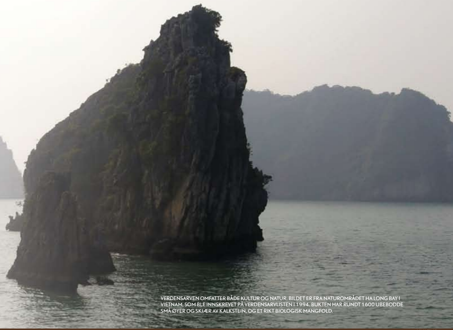
VERDEN SARVEN OMFATTER BÅDE KULTUR OG NATUR. BILDET ER FRA NATUROMRÅDET HA LONG BAY I VIETNAM, SOM BLE INNSKREVET PÅ VERDEN SARVLISTEN I 1994. BUKTEN HAR RUNDT 1 600 UBEBODDE SMÅ ØYER OG SKJÆR AV KALKSTEIN, OG ET RIKT BIOLOGISK MANGFOLD.

Det er bred enighet om at bevaring av verdensarven er viktig. Men det er store diskusjoner rundt hvor lang listen bør være, dens geografiske og tematiske balanse og hvordan man sikrer kvaliteten på innskrevne steder. UNESCO-kommisjonen vil arbeide fram mot 2012, verdensarvkonvensjonens 40-års-jubileum, for å belyse disse.