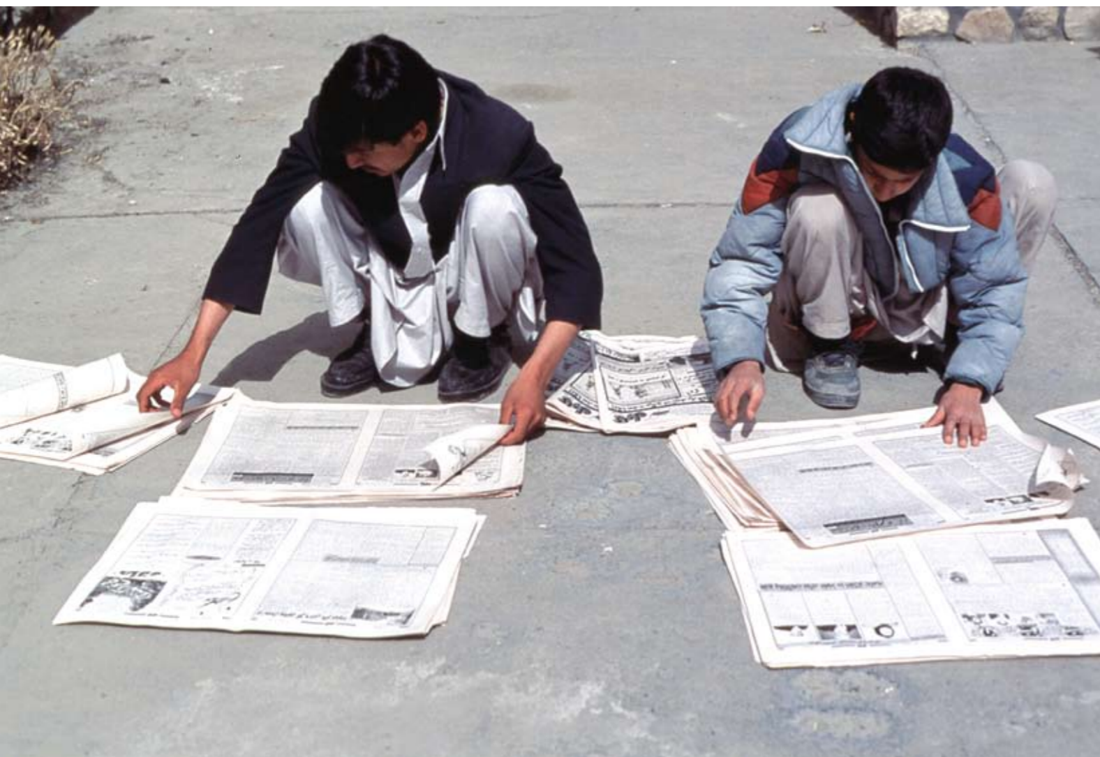
TO MENN REDIGERER KABUL WEEKLY, DEN FØRSTE UAVHENGIGE AVISA I AFGHANISTAN. AVISA BLIR STØTTA AV UNESCO, AINA OG REPORTERS SANS FRONTIERS. UNESCO SER PÅ ÅPEN TILGANG TIL INFORMASJON SOM HEILT NAUDSYNT FOR Å KUNNA BYGGJE EIT VELFUNGNERANDE DEMOKRATI.

UNESCOs kommunikasjonssektor har dei siste åra styrkt arbeidet for ytringsfridom, pressefridom, medieavhengigheit, mediepluralisme og tryggleik for journalistar.